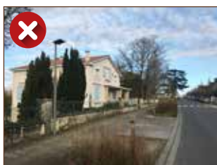
Photo prise trop près, toute la rue n'est pas visible

Méthodologie : réaliser la photographie en se mettant sur la voie publique et en cadrant l'ensemble de la rue